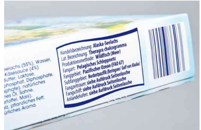
Beispiel für die vollständige Kennzeichnung eines Fischproduktes

Nachhaltigkeit und Transparenz sind dabei gefragt, ebenso eine vollständige Kennzeichnung der Produkte. Nur so kann an Regal oder Fischtheke die richtige Wahl getroffen werden. Folgende Angaben müssen zur Vollständigkeit vorhanden sein: