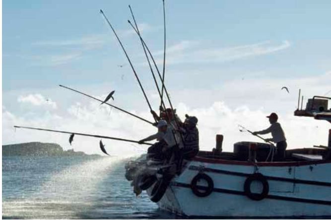
Mit Ruten und Leinen gefangener Fisch – eine nachhaltige Alternative